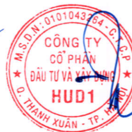
Dương Tất Khiêm