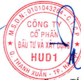
Đương Tất Khiêm